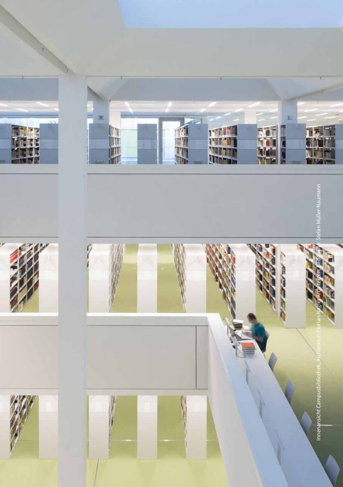
Innenansicht Campusbibliothek, Architektur: Florian Nagler/Architekten, Bildmontage: Stefan Müller-Naumann